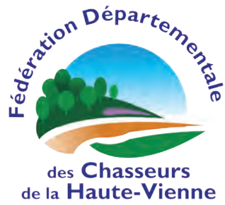
Schéma Départemental de Gestion Cynégétique